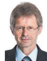
RNDr. Miloš Vystrčil

Absolvent radiotechniky na ČVUT v Praze a Metropolitní univerzity Praha. V letech 1991 až 1998 starosta Jihlavy. V letech 2005–2012 prezident NKÚ. R. 2010 odsouzen za zneužití pravomoci úřední osoby. Zemřel 10. 8. 2013, ve věku 53 let.