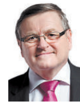
MUDr. Jiří Běhounek

Absolvent Masarykovy Univerzity v Brně. V letech 1998–2001 starosta Telče, v letech 2004–2008 hejtman kraje Vysočina. Ve volbách 2010 se stal senátorem za obvod č. 52 – Jihlava. Od srpna 2020 předseda Senátu PČR.