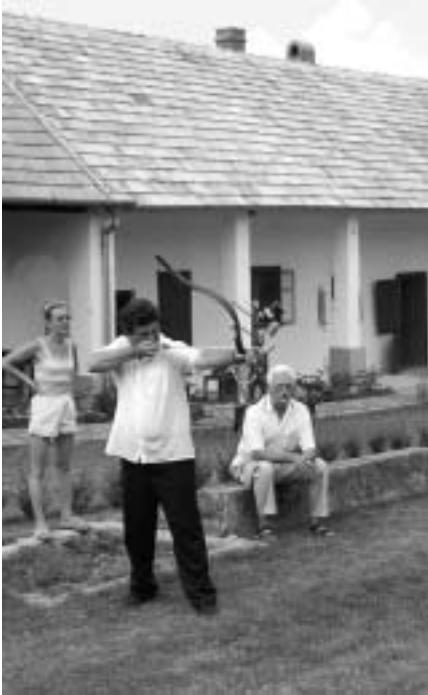
A Falunapon a két testvérváros vezetői íjászkodnak

Az I. világháborúban, 1914 és 1918 között 26 halottja volt a községnek. Az első világháború befejezése után Kisújfalu Csehszlovákia részévé vált, majd Magyarországhoz csatolták 1937-ben. Nem sokkal utána kitört a II. világháború, amelynek következtében a háború végéhez közeledve a község több héten keresztül közvetlen harcterré vált. Ennek eredményeként a faluban 31 személy vesztette életét és 4 ház dőlt romba. A község ismét Csehszlovákia része lett. 1947-ben a háború utáni kitelepítés 60 családot, 200 személyt érintett.