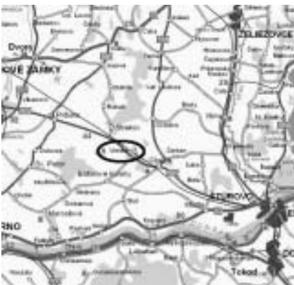
Kisújfalu szűkebb környezete

védelmi Körzet. A második védett terület a Párizs-patak és környéke Természetvédelmi Terület, a harmadik, pedig a Somlyó-hegy.