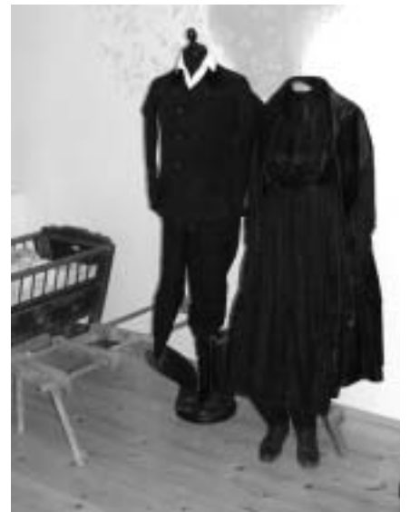
Helyi ünnepi viselet, háttérben a restaurált díszes festés a falon