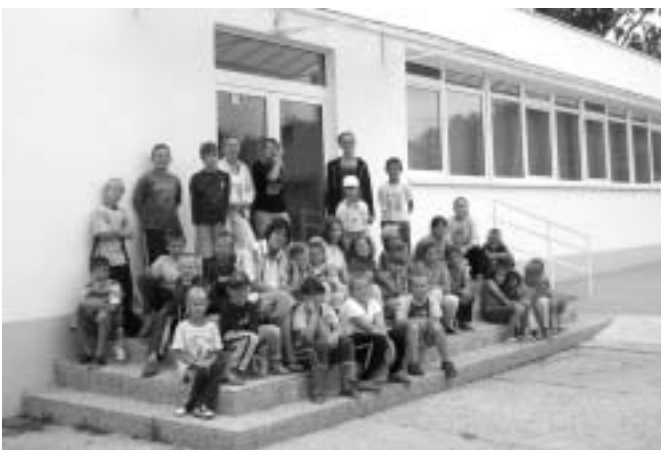
A kisújfalusi és budaörsi gyerekek közös nyári tábora (2006. augusztus)