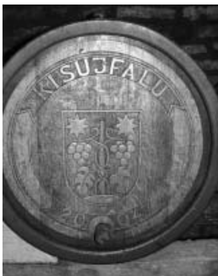
Kisújfalu címere az egyik hordón

Csehszlovákia kettéválása után 1993-ban Kisújfalu (Nová Vieska) Szlovákia része lett. A rendszerváltás után Budaörs Város Önkormányzata jelentős támogatásával létrehozta a „Faluházat”, mely jelentős hagyományörző és kulturális központ. Európai Uniós támogatással a klubtevékenység és a kulturális élet további fellendítésére átépített új épületben létrehozta a falu szívében a Kulturális Központot.