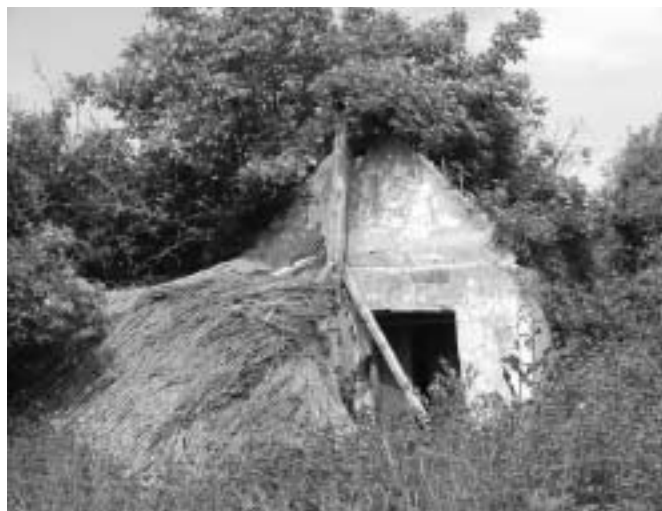
A régi pincék közül sok már összedőlt