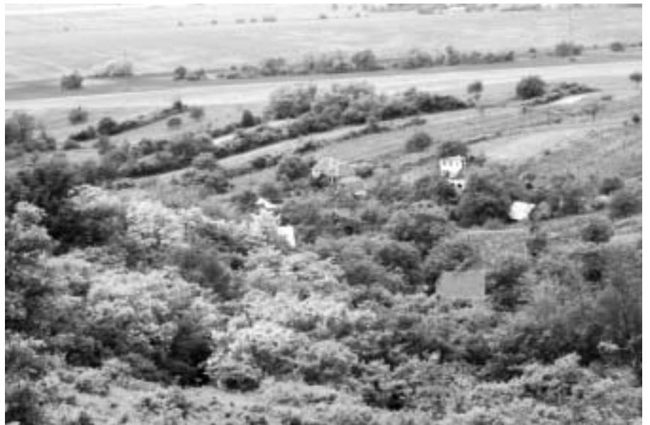
A szőlővel és gyümölcsösökkel beültetett hegyoldal