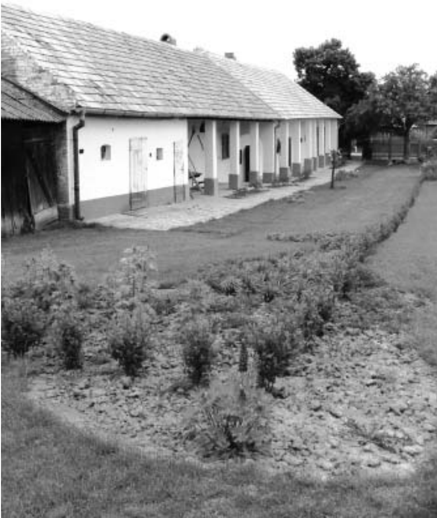
Faluházként egy jellegzetes tornácos ház került felújításra Budaörs támogatásával