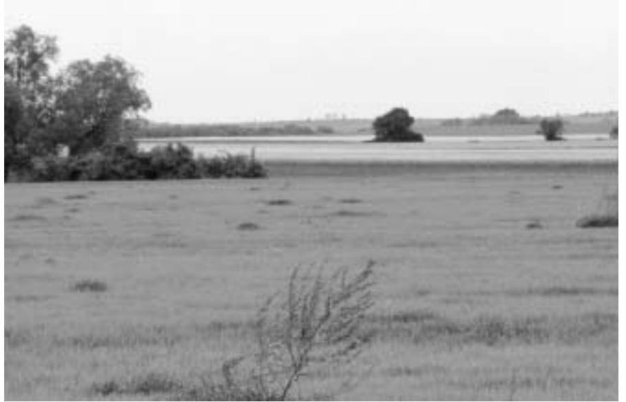
A környező szántóföldek

Kisújfalu teljes víz- és gázhálózattal rendelkezik.