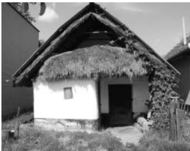
Egy szépen felújított régi pince