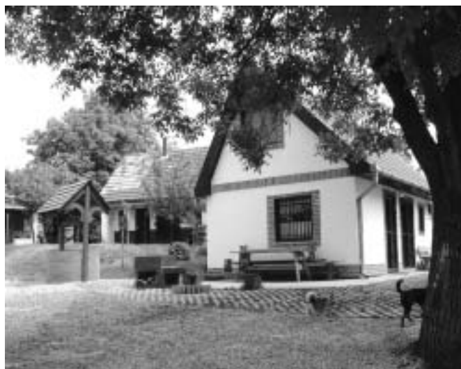
Ma is épülnek új pincék