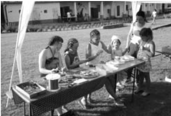
Kézműves foglalkozás a Falunapon (2006. június 24.)

Jelentős befolyással volt a község életére a Bécs Budapesttel összekötő vasútvonallal megépítése, így 1850-től a község önálló vasútállomással rendelkezik. Nagy tűzvész volt a helységben, 1874-ben, amely 13 épület híján az egész községet elhamvasztotta.