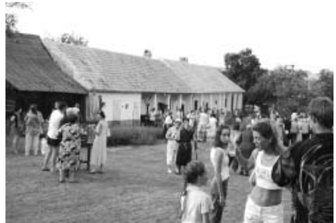
A környék településekről is sok látogató érkezik a rendezvényekre