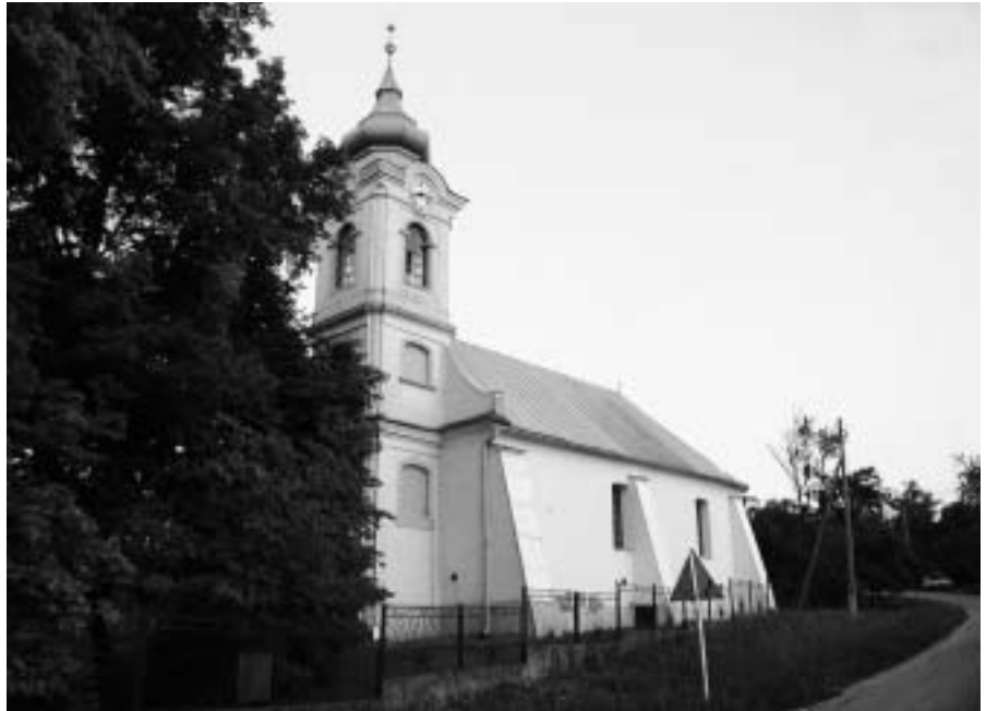
A falu temploma

A község kataszterében három természetvédelmi terület található. A legjelentősebb és legnagyobb is egyben a Párizsi-mocsarak Nemzeti Természet-