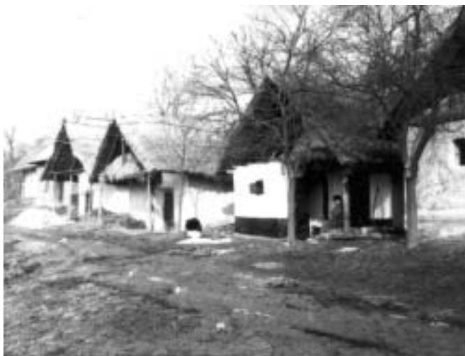
A pincék egykor