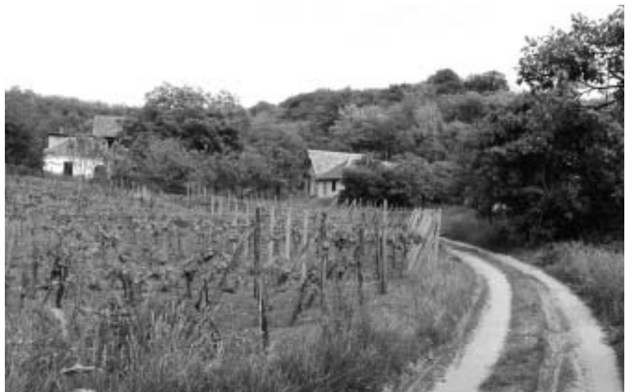
Úton a Somlyó-hegyre