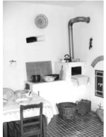
A konyha a hagyományos tűzhellyel